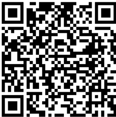
QR-Code Meldeplattform Asiatische Hornisse

Um möglichst rasch Maßnahmen zum Fang der Königinnen und Beseitigung der Nester der Asiatischen Hornisse zu veranlassen, bittet das Ministerium für Umwelt, Klima und Energiewirtschaft um Meldung von Sichtungen in Baden-Württemberg. Dies ist über die Meldeplattform auf der Homepage der Landesanstalt für Umwelt (LUBW), aber auch über die kostenlose „Meine Umwelt-App“ möglich: