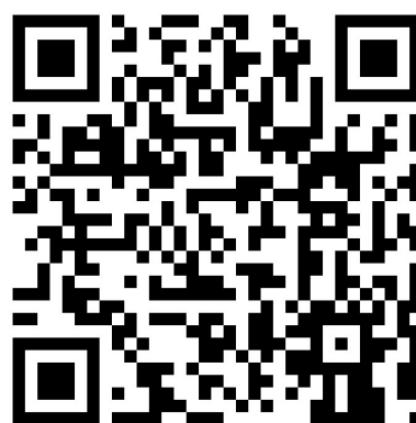
QR-Code Meine Umwelt-App

Weitere Informationen zur Asiatischen Hornisse und wie sich die Art von heimischen Insekten unterscheiden lässt finden sich auf der Homepage der LUBW https://www.lubw.baden-wuerttemberg.de/natur-und-landschaft/asiatische-hornisse sowie auf der Homepage der Landesanstalt für Bienenkunde der Universität Hohenheim unter https://bienenkunde.uni-hohenheim.de/vespavelutina .